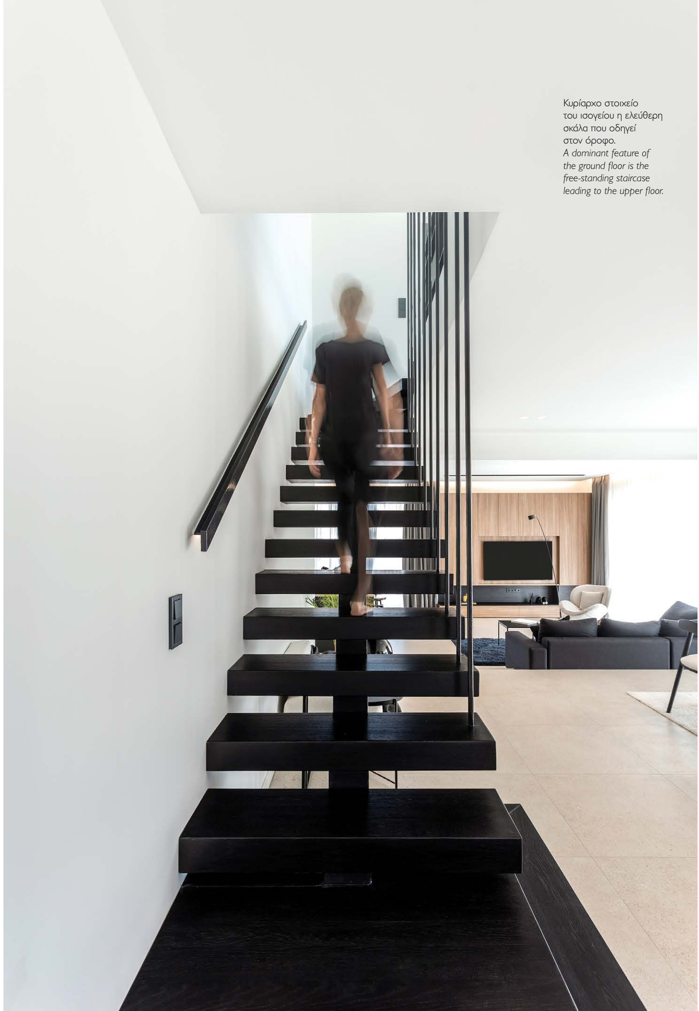
Κυρίαρχο στοιχείο του ισόγειου η ελεύθερη σκάλα που οδηγεί στον όροφο. A dominant feature of the ground floor is the free-standing staircase leading to the upper floor.