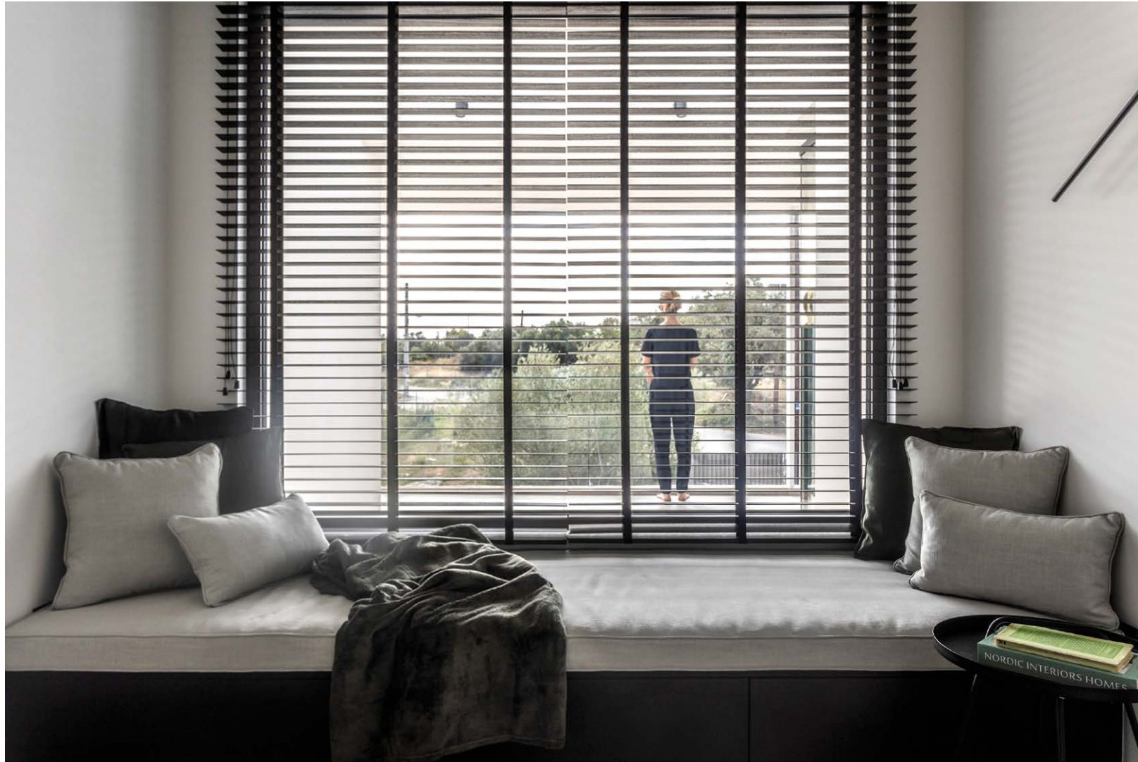
Στον όροφο βρίσκεται και ένα δευτερεύον, προστατευμένο καθημερινό καθιστικό. On the upper floor, there is also a secondary, protected daily living room.